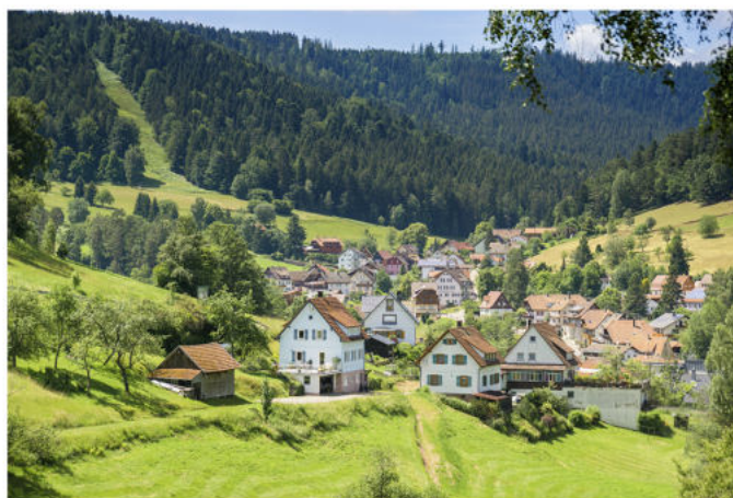
Blick vom Heidelbeerweg auf Enzklosterle

Auch viele andere Tiere fressen gerne Heidelbeeren: Rotwild, Reh, Fuchs, Eichhörnchen und Mäuse.