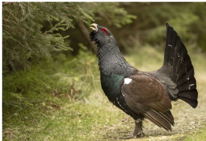
Ein Auerhahn auf einem Waldweg