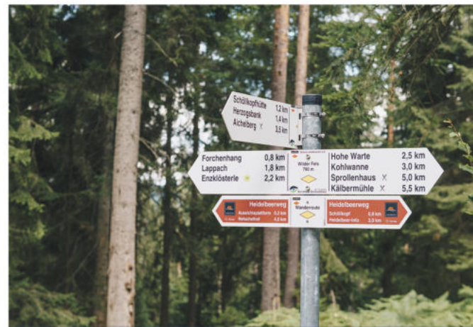
Durchgehende Beschilderung mit Genießerpfad-Zeichen (Bollenhut)